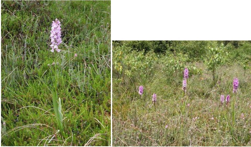
Abbildungen des Moorknabenkrauts aus dem Informationsblatt des Kreises Steinburg (Internet)

Bei SUNDERMANN (1980) wird die Unterart elodes bei der Unterart maculata einbezogen, da sie nicht über ausreichend differenzierende Merkmale verfügt. Füller (1983) dagegen beschreibt die Unterart elodes , die Abbildung dazu entspricht jedoch der der ssp. maculata bei SUNDERMANN.